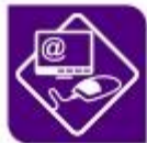
Informática e comunicacións