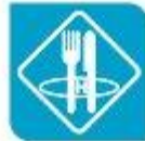
Hostalaría e turismo