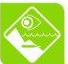
Seguridade e medio ambiente