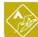
Actividades físicas e deportivas