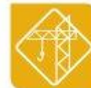
Edificación e obra civil