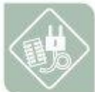
Electricidade e electrónica