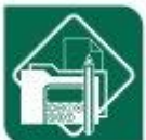
Administración e xestión