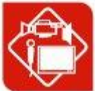
Imaxe e son