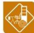
Madeira, moble e cortiza